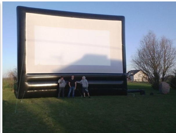
WARIANT L -