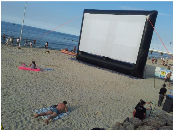
WARIANT XL -