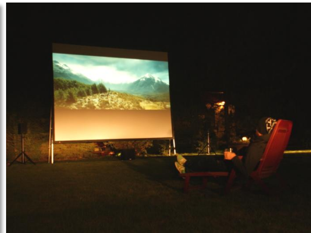
WARIANT M -